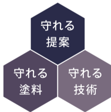
ハートフルハウスの外装リフォームの3つの強み

では、アステックペイントの技術研修会を受講し、修了証を取得した施工技術者が担当しております。従って、職人によるミスを防げることはもちろん、商品本来の性能を発揮することが可能です。アステックペイントでは塗布量など必要条件を満たした塗装現場にのみ保証書の発行を行っていますので、お客様が塗装後も安心して過ごしていただけるようになっております。